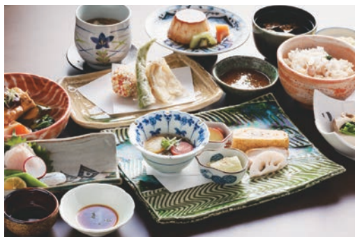
ディナーコースの一例