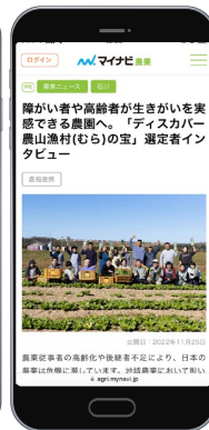
メディア媒体（アウモ、マイナビ）での記事掲載