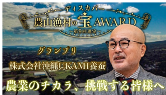
取組紹介のPR動画（グランプリ地区）