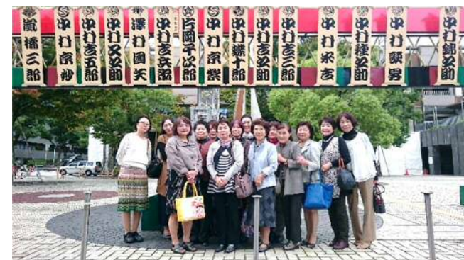
御園座 (歌舞伎が名古屋にやってきた)