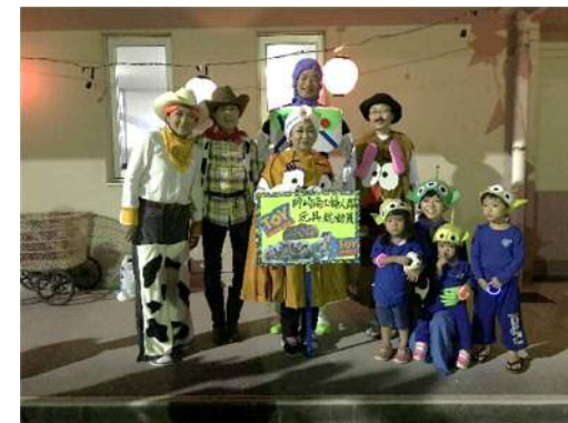
H29 TOY ストーリー バズが「特別賞」を頂きました