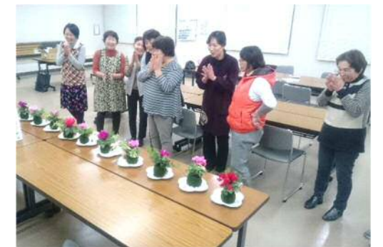
H28 コケ玉作り かわいく出来ました