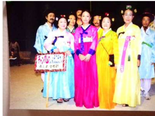
チャングムのしょうこうかい あんにょんはせよ～