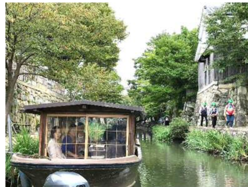
H29 貴船 滋賀 近江八幡