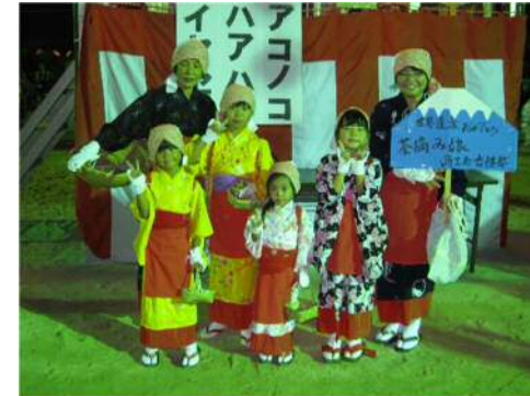
H25 茶摘み(夏も近づく八十八夜)