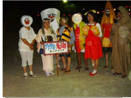
後ろに事務局 (からかさお化け いったんもめん)