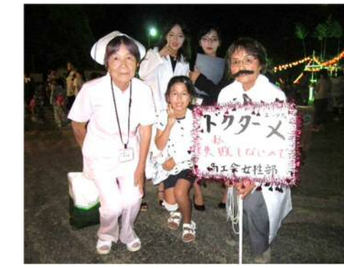
H30 決めゼリフが良いですね