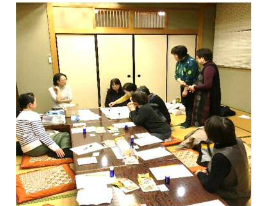
アロマの芳しい香りに包まれて