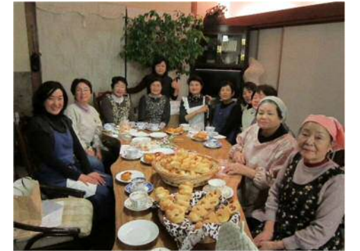
H25 パン作り パン生地をこねるところから