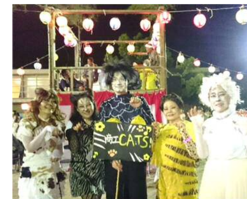
H27 CATS プラカードにご注目 師崎 (M)