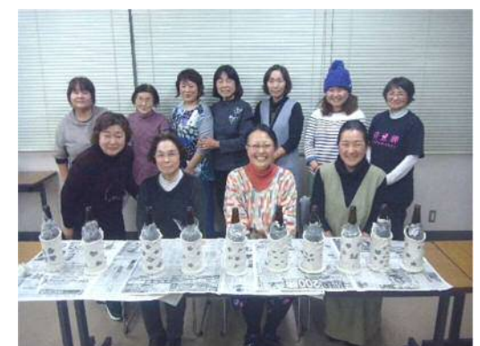
キャンドルライト作り (粘土をこねてキャンドル作り)