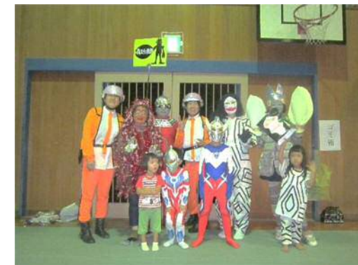
H30 懐かしの怪獣たち