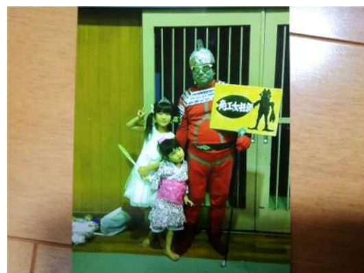
シュールなウルトラセブン