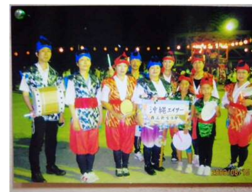
沖縄エイサー (太鼓はダンボール)