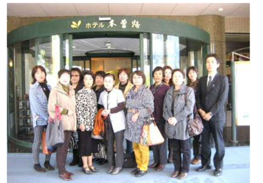
H25 ホテル木曾路 すべて山の中