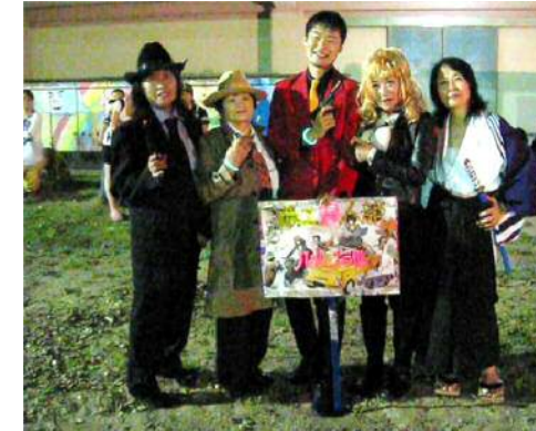
H26 ルパン三世 ふう～じいこちゃあ～ん