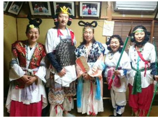
H28 ヤマトタケルなど神話の神