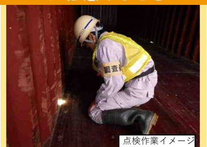
点検作業イメージ