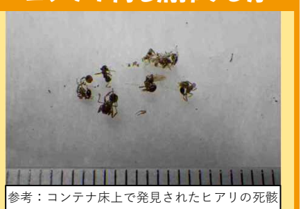
参考：コンテナ床上で発見されたヒアリの死骸