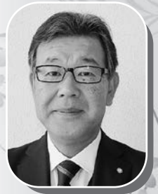
◆美浜町商工会会長

商工会は地域経済の要であります。新年が会員皆様のご健勝ご繁栄となります事を祈念致しまして、新年のご挨拶とさせていただきます。