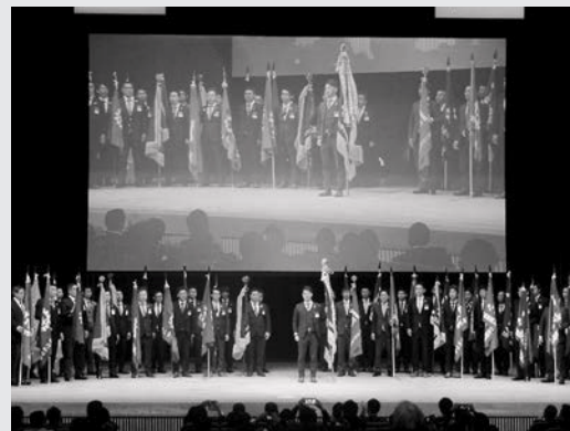
大 団 円