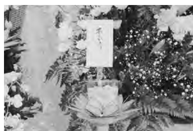
手づくりローソクありが灯