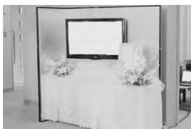
思い出のスライドショー